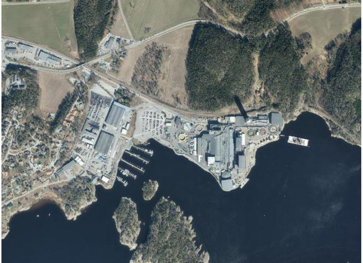
Figur 1 Flyfoto av Nexans industriområde