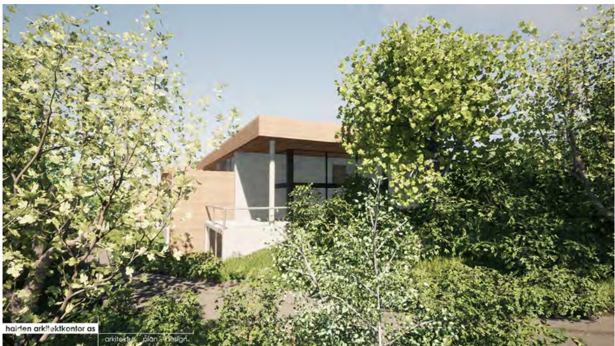
Planlagt bebyggelse er godt integrert i terrenget og tar hensyn til eksisterende grøntstruktur.