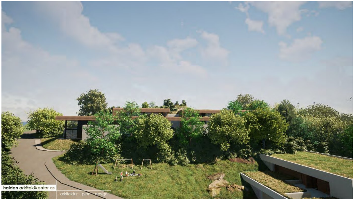
Felles lekeplass for de 19 byboligene