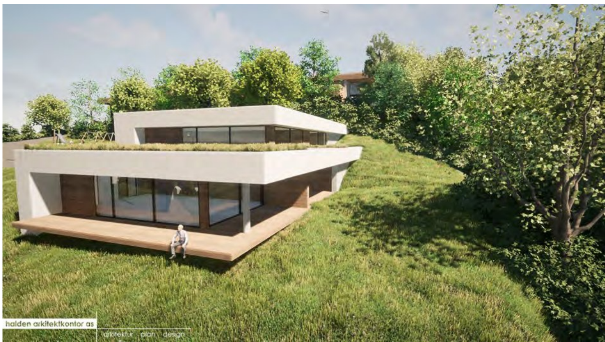
Det arkitektoniske grepet gjør at bygningen ser ut til å vokse ut av terrenget.