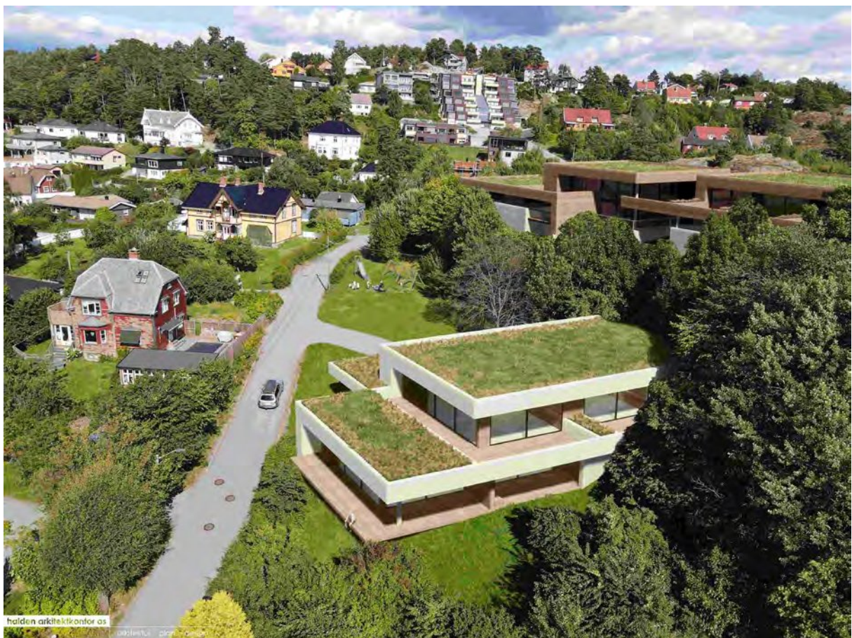
Dronebilde med ny bebyggelse innpasset.