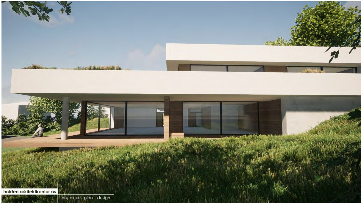
Utsikt over byen