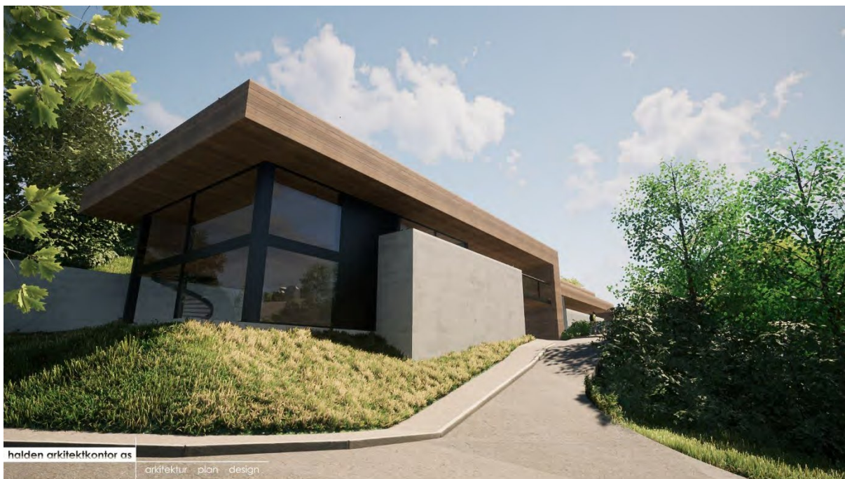
Adkomstveien til Oskleiva 29, 31 og 33, med forslag til ny bebyggelse (15 nye byboliger) langs veien.