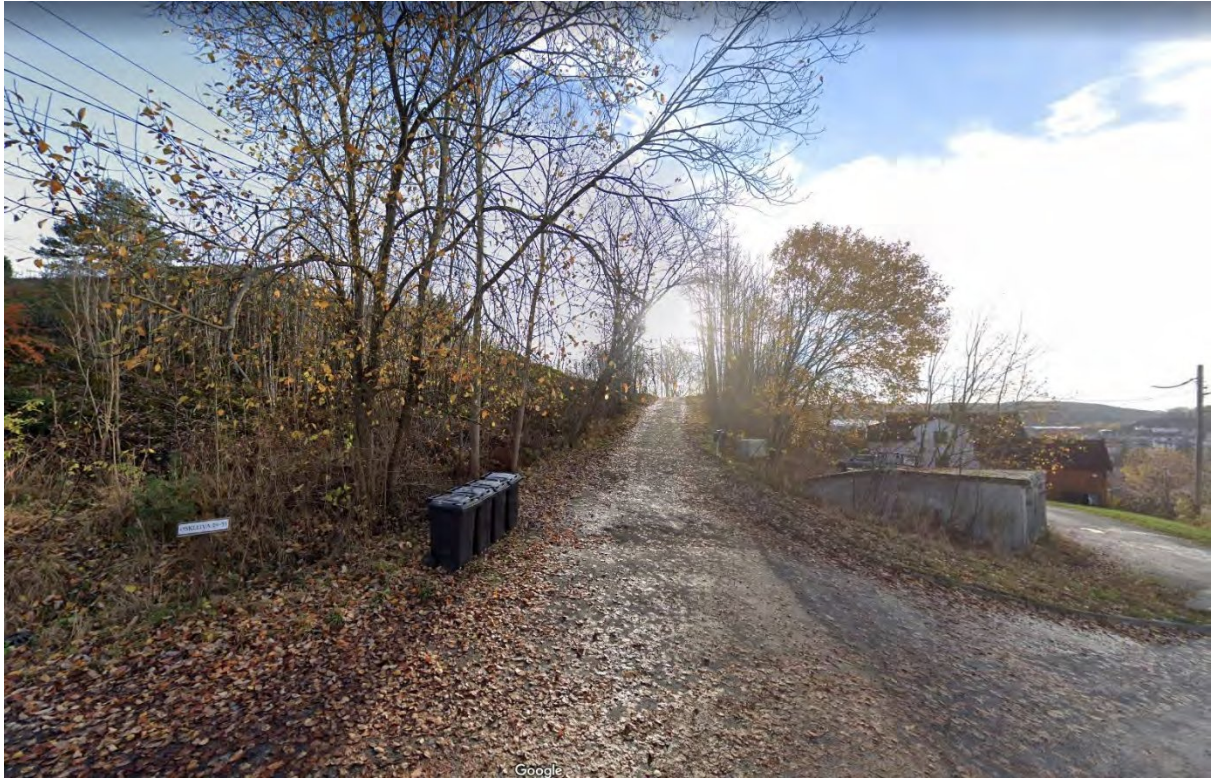
Adkomstveien til Oskleiva 29, 31 og 33.