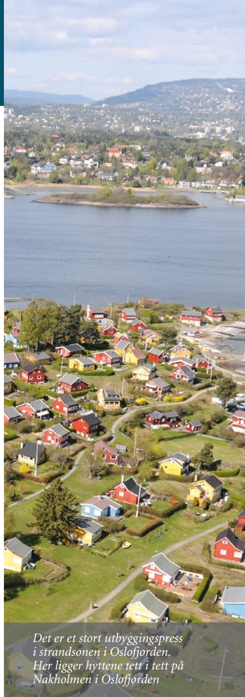
Det er et stort utbyggingspress i strandsonen i Oslofjorden. Her ligger hyttene tett i tett på Nakholmen i Oslofjorden

For å sikre en demokratisk beslutningsprosess og ivareta alle hensyn og interesser, må kommunen vurdere om tiltaket bør fremmes i form av en reguleringsplan. Et tiltak som har vesentlig virkning for miljø og samfunn, bør behandles gjennom en planprosess (kommuneplan eller reguleringsplan). Dersom kommunen kommer til at tiltaket omfattes av en reguleringsplikt, er dette et selvstendig avslagsgrunnlag for dispensasjonssøknaden.