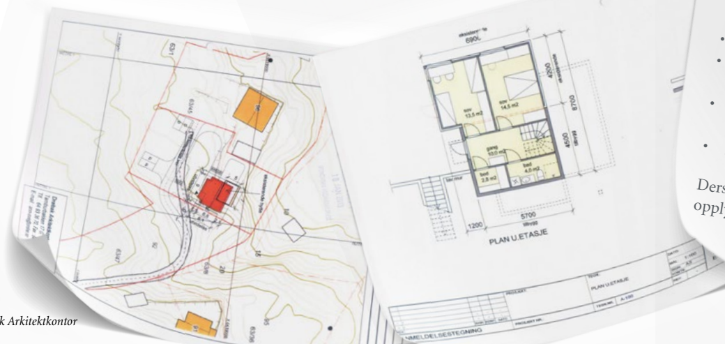
Tegn: Drøbak Arkitektkontor