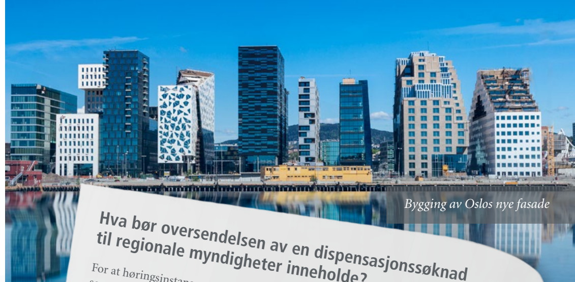
Bygging av Oslos nye fasade

Det at et offentlig organ gir en uttalelse i negativ eller positiv retning innebærer imidlertid ikke automatisk at dispensasjonssøknaden må avslås eller godkjennes, men uttalelsen skal tillegges særlig vekt ved kommunens dispensasjonsbehandling.