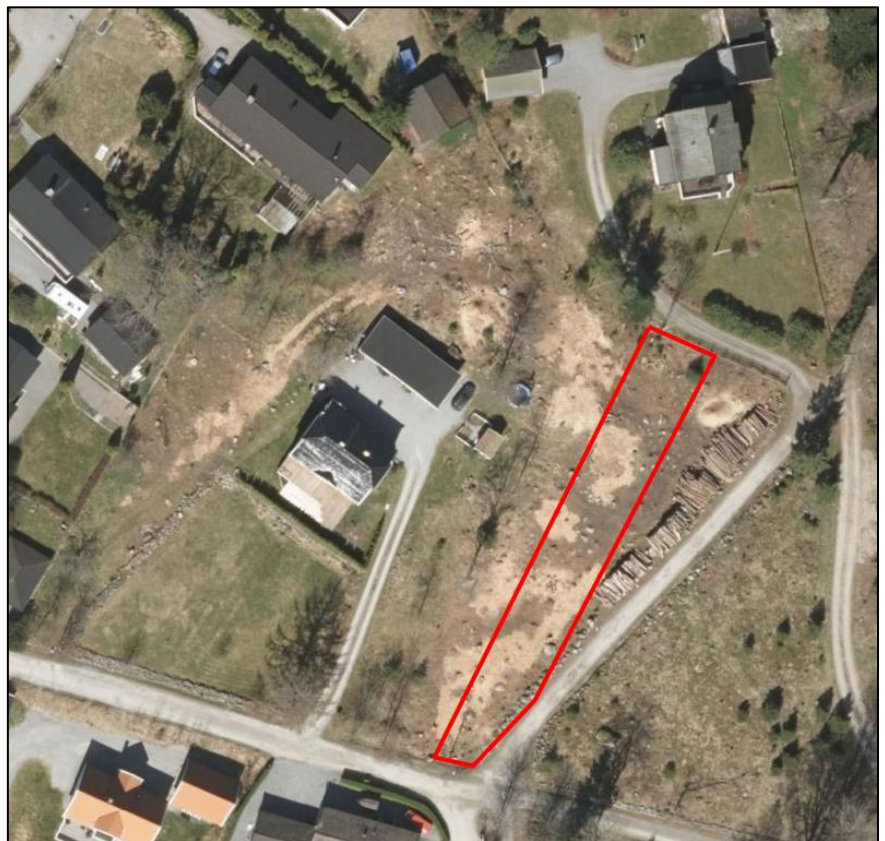
Figur 3. Arealet vist i ortofoto der vegetasjonen i området nylig er fjernet.