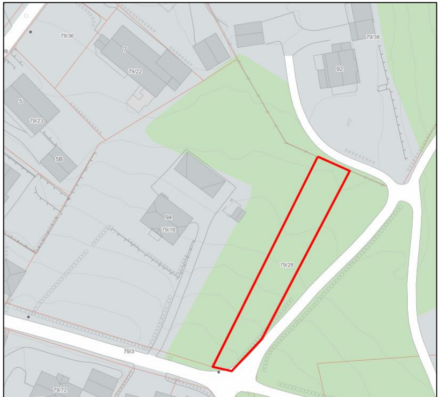
Figur 2. Tomta er vist med rød linje.