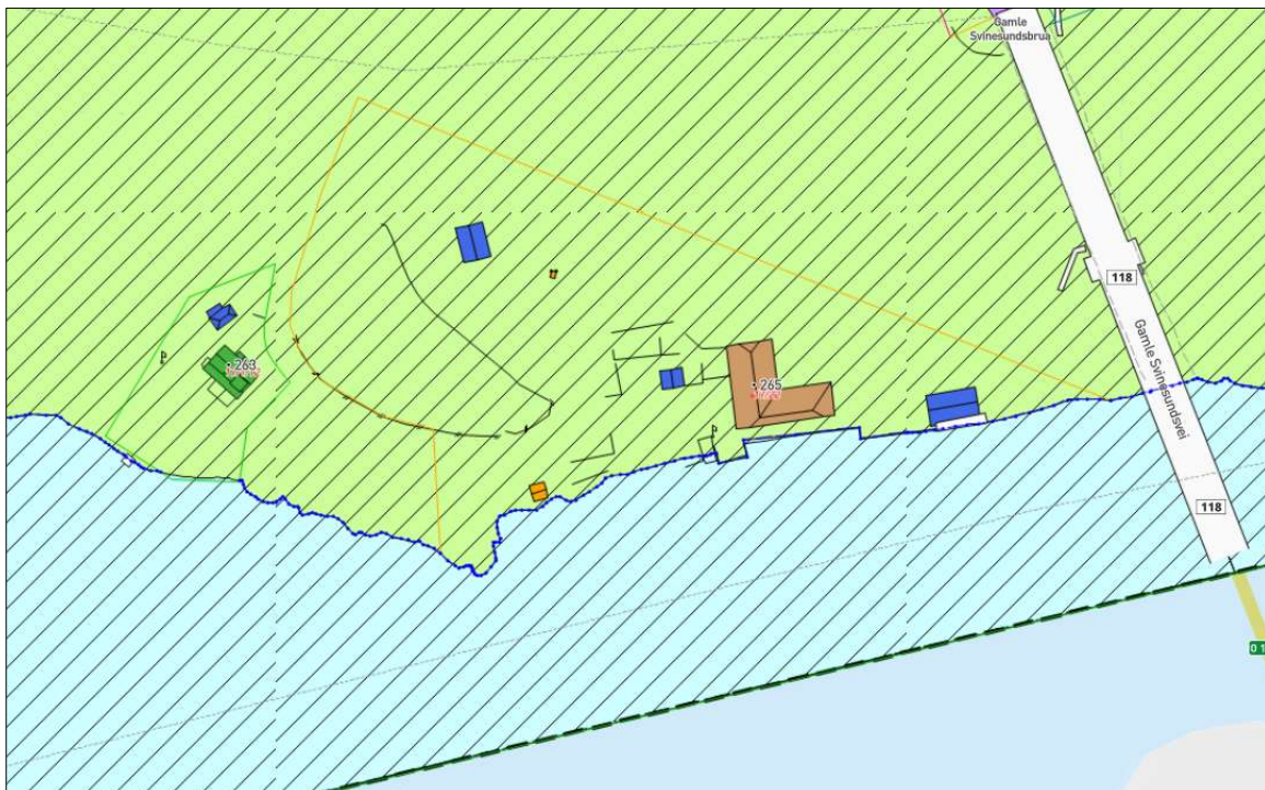
Figur 1. Gjeldende kommuneplan. Eiendomsgrense vist med oransje strek

Eiendommen gnr. 17, bnr. 22 omfattes av detaljreguleringsplan G-600 for områdene langs gamle E6 fra Svinesund til Hellekleva. Gjeldende kommuneplan anviser eiendommen i sin helhet som LNF-formål med hensynssone bevaring av kulturmiljø H_570.