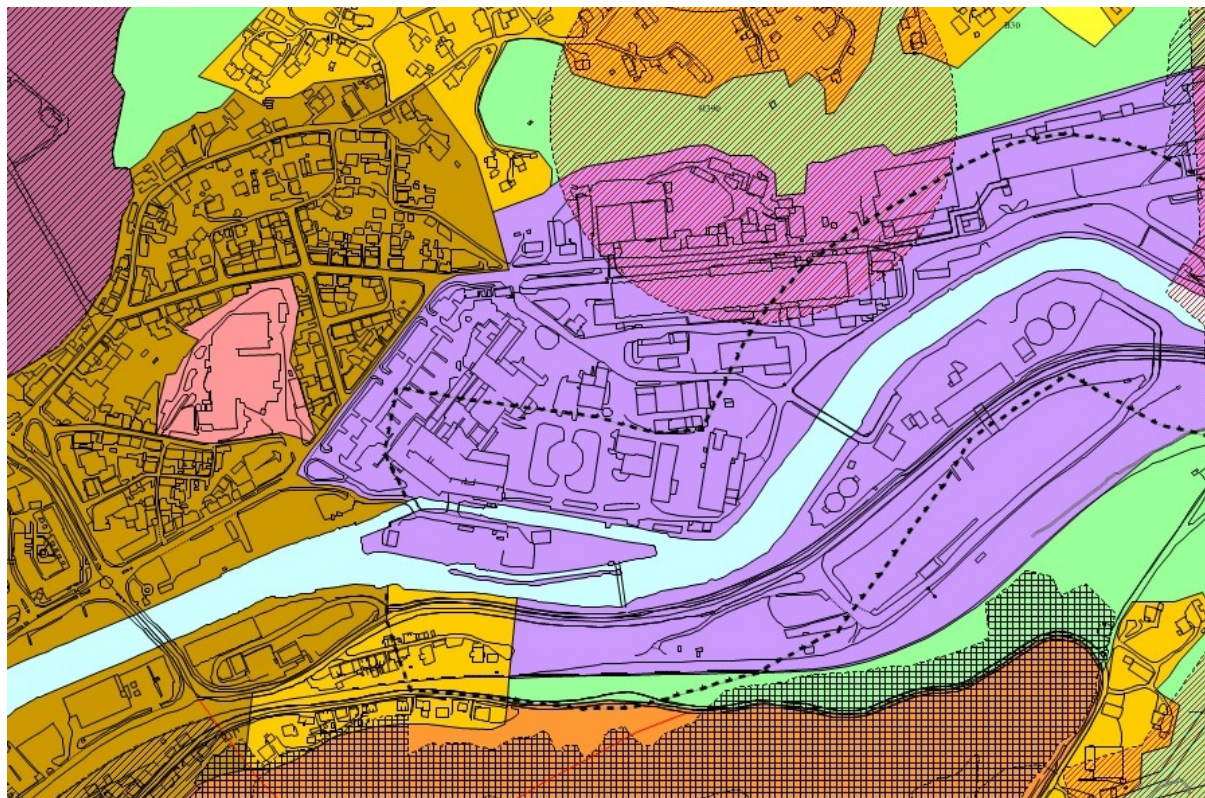
Utsnitt av gjeldende kommuneplan

Målet er å få en samlokalisert skole i sentrum.