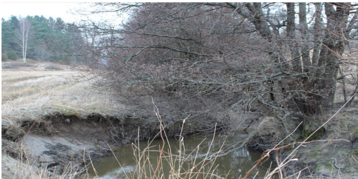
Tilskudd til sikring av bekkekanter faller innenfor SMIL-ordningen.