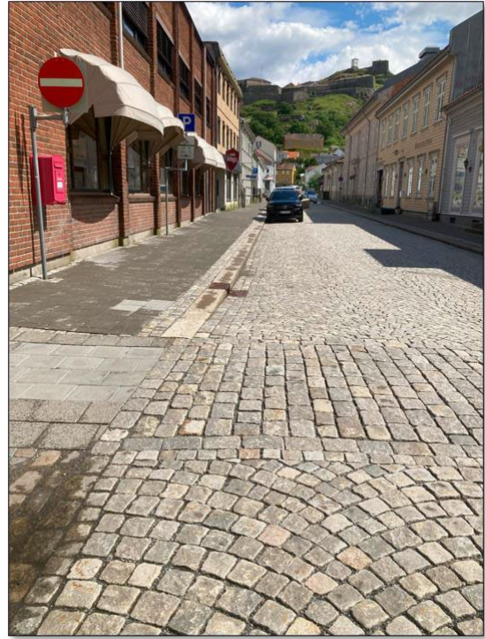
Bilde fra Borbergata

Gågata i Halden er inndelt med en møbleringszone belagt med gatestein og gangsoner med betongheller. Gangsonen midt i gågata er imidlertid brutt med gatestein flere steder. Gangsonene mot fasadelivet blir flere steder brutt av trapper og enkelte steder med møblering.