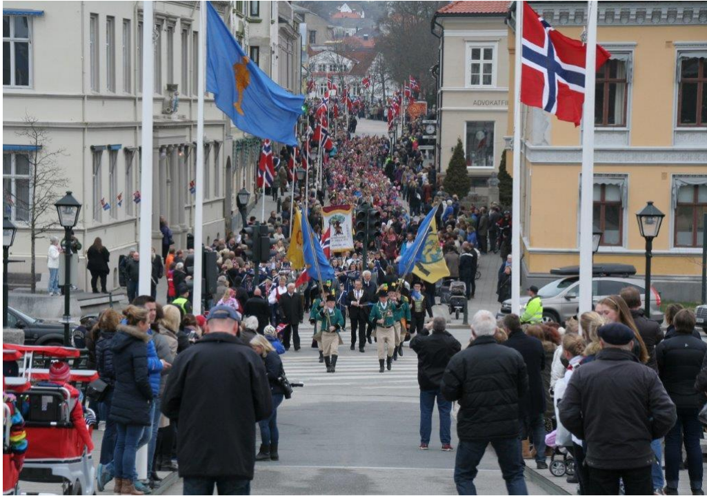
Bilde: Halden 350 år