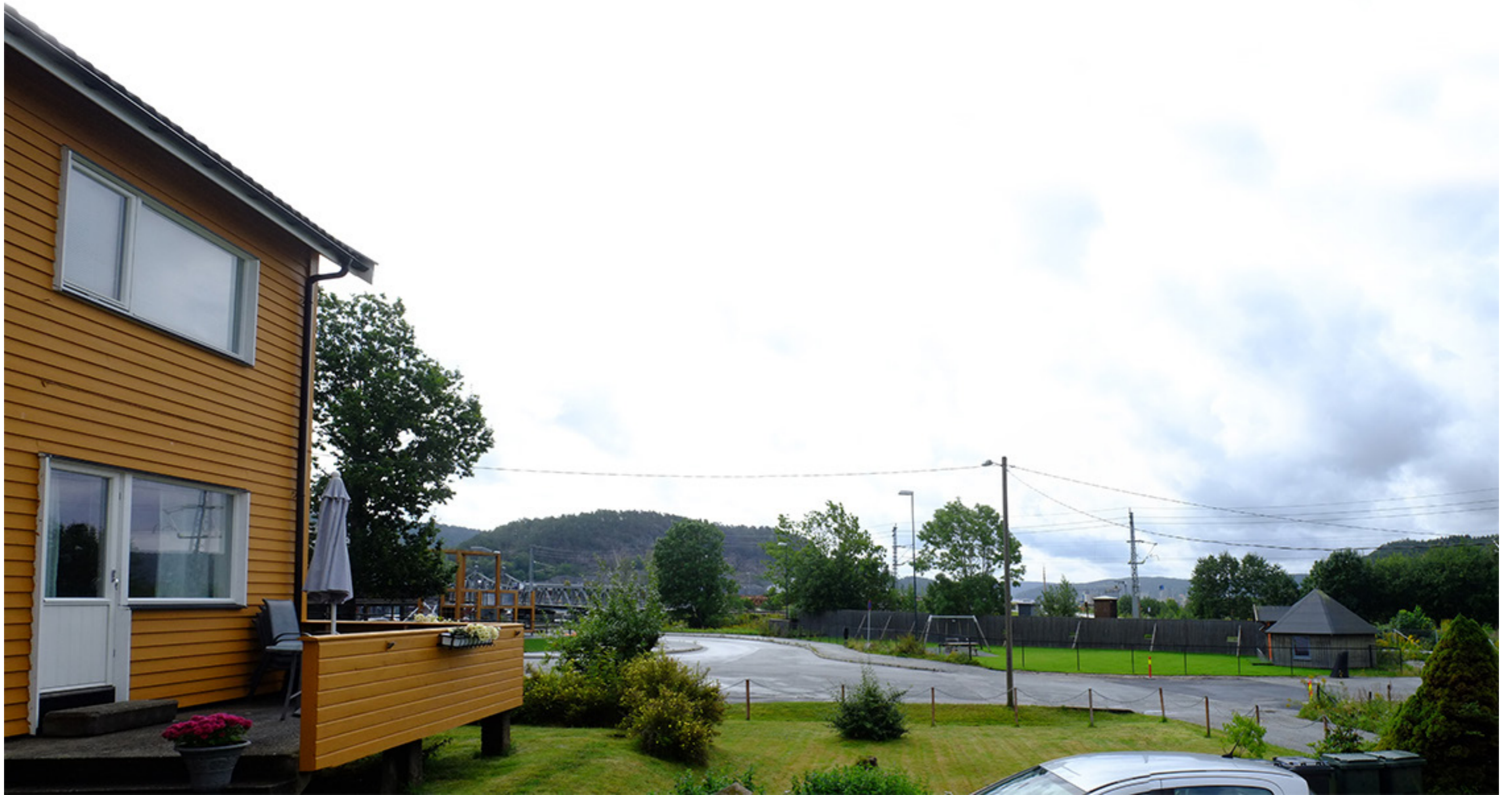
Fredrikshald brygge sett fra Refneveien uten bebyggelse