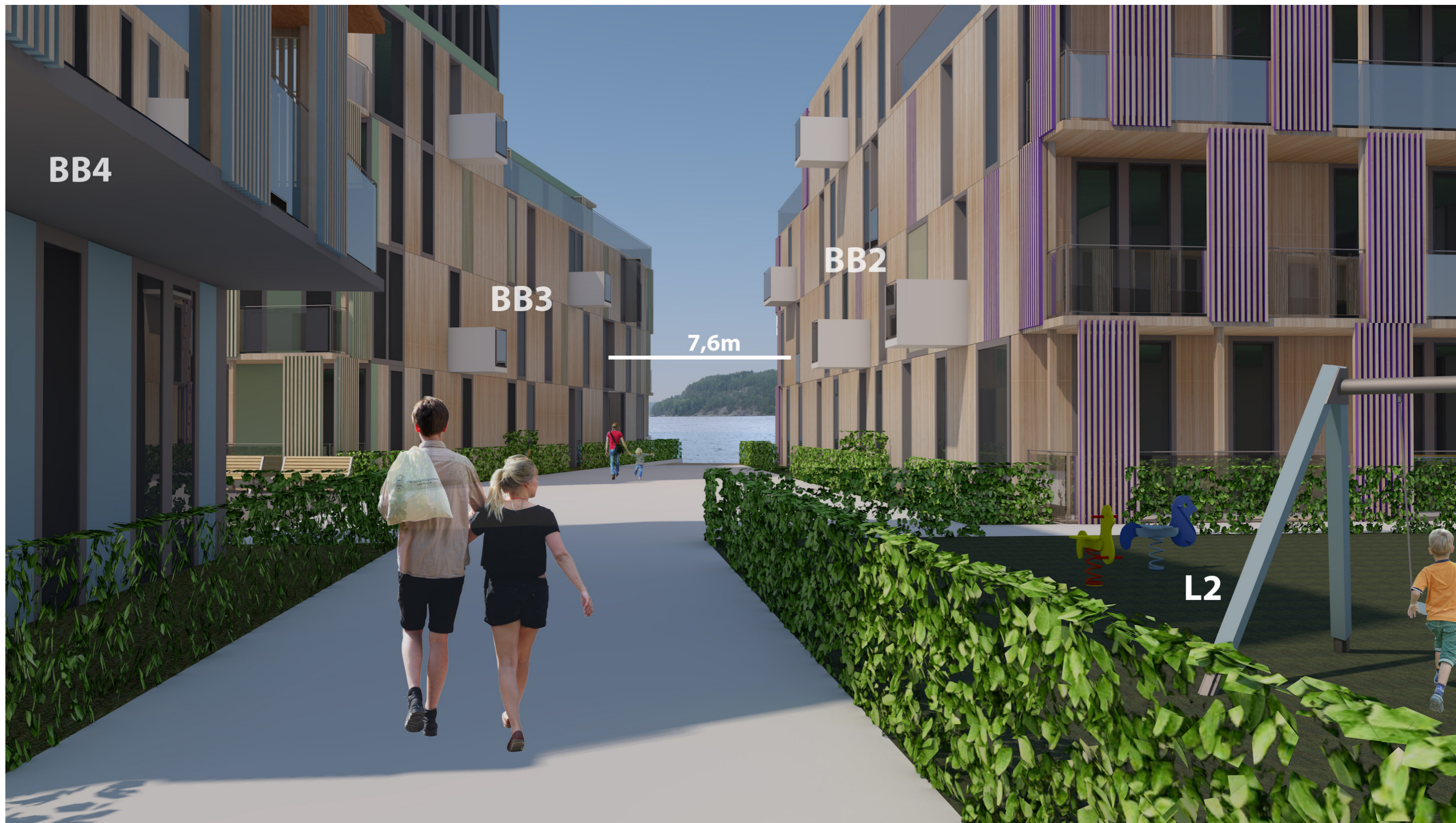
Fredrikshald brygge - Gaterom sett fra GT2 mot BB2 og BB3