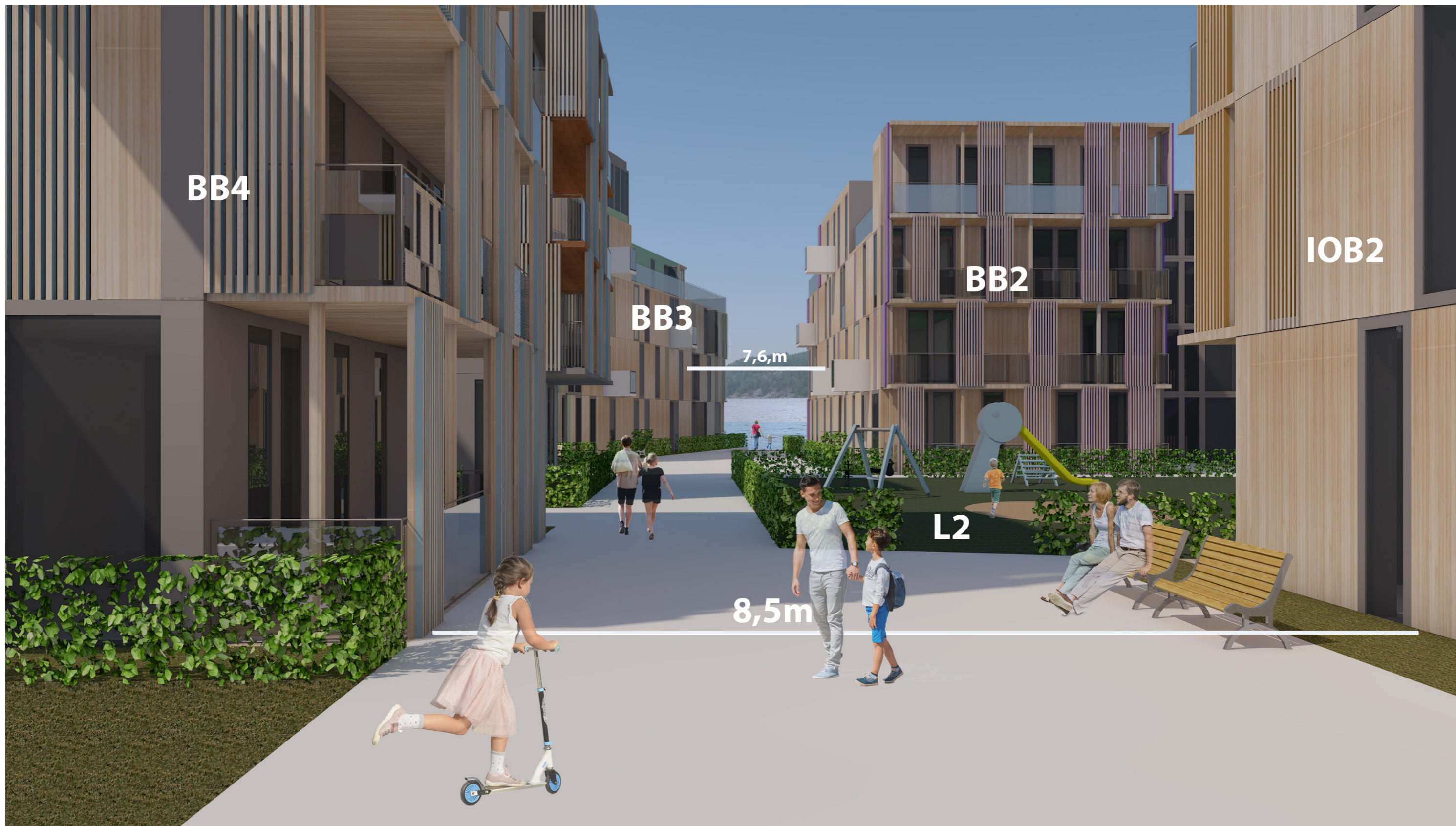
Fredrikshald brygge - Gaterom sett fra GT2 mot BB2 og BB3