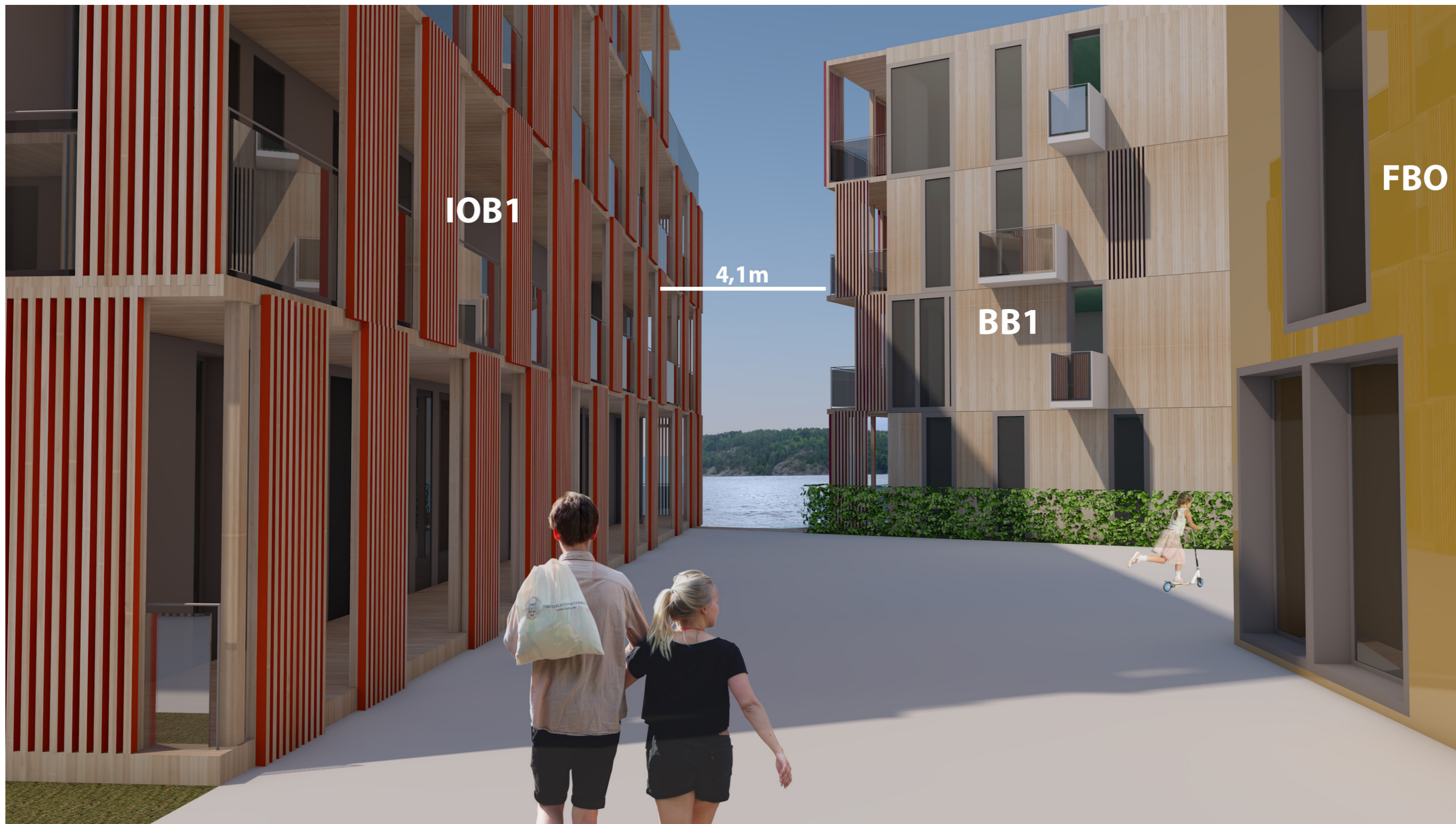
Fredrikshald brygge - Gaterom sett fra GT1 mot IOB1 og BB1