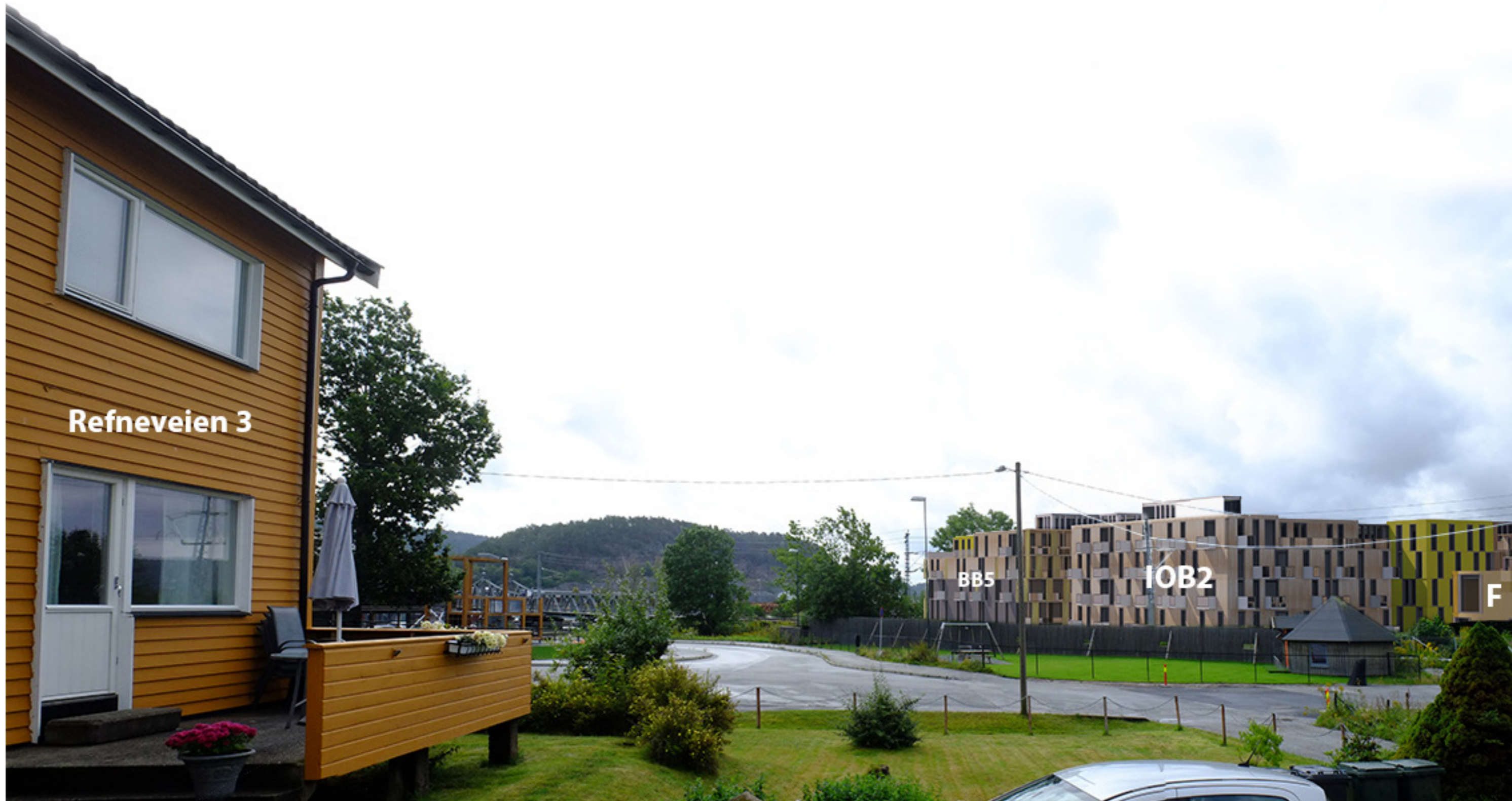
Fredrikshald brygge sett fra Refneveien med bebyggelse