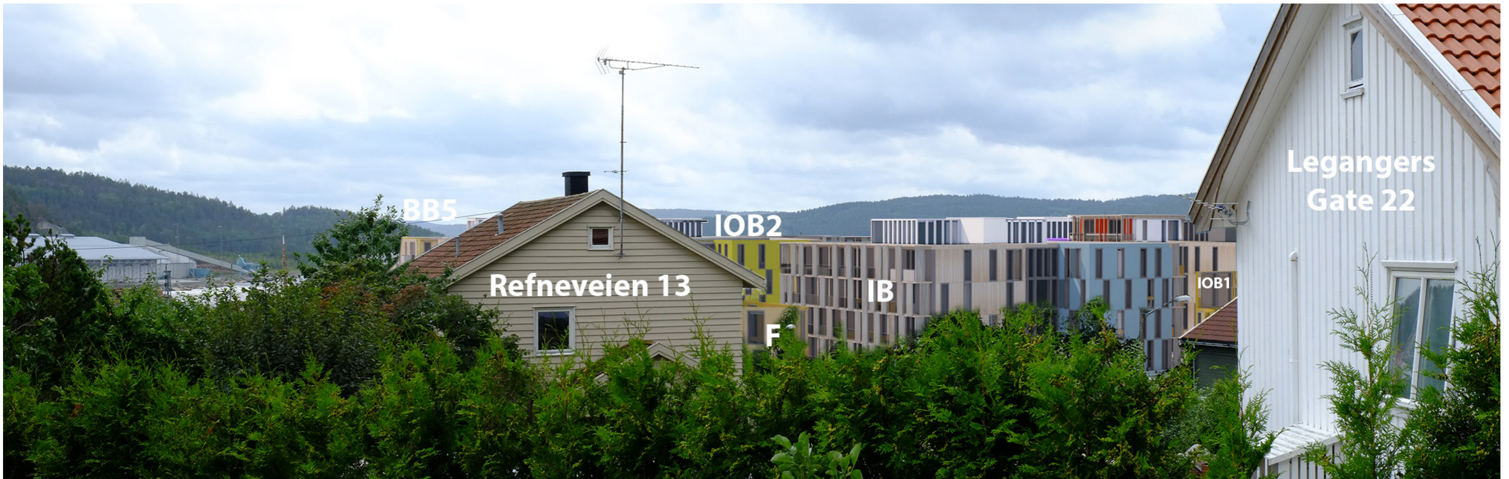
Fredrikshald brygge sett fra Legangers Gate med og uten bebyggelse