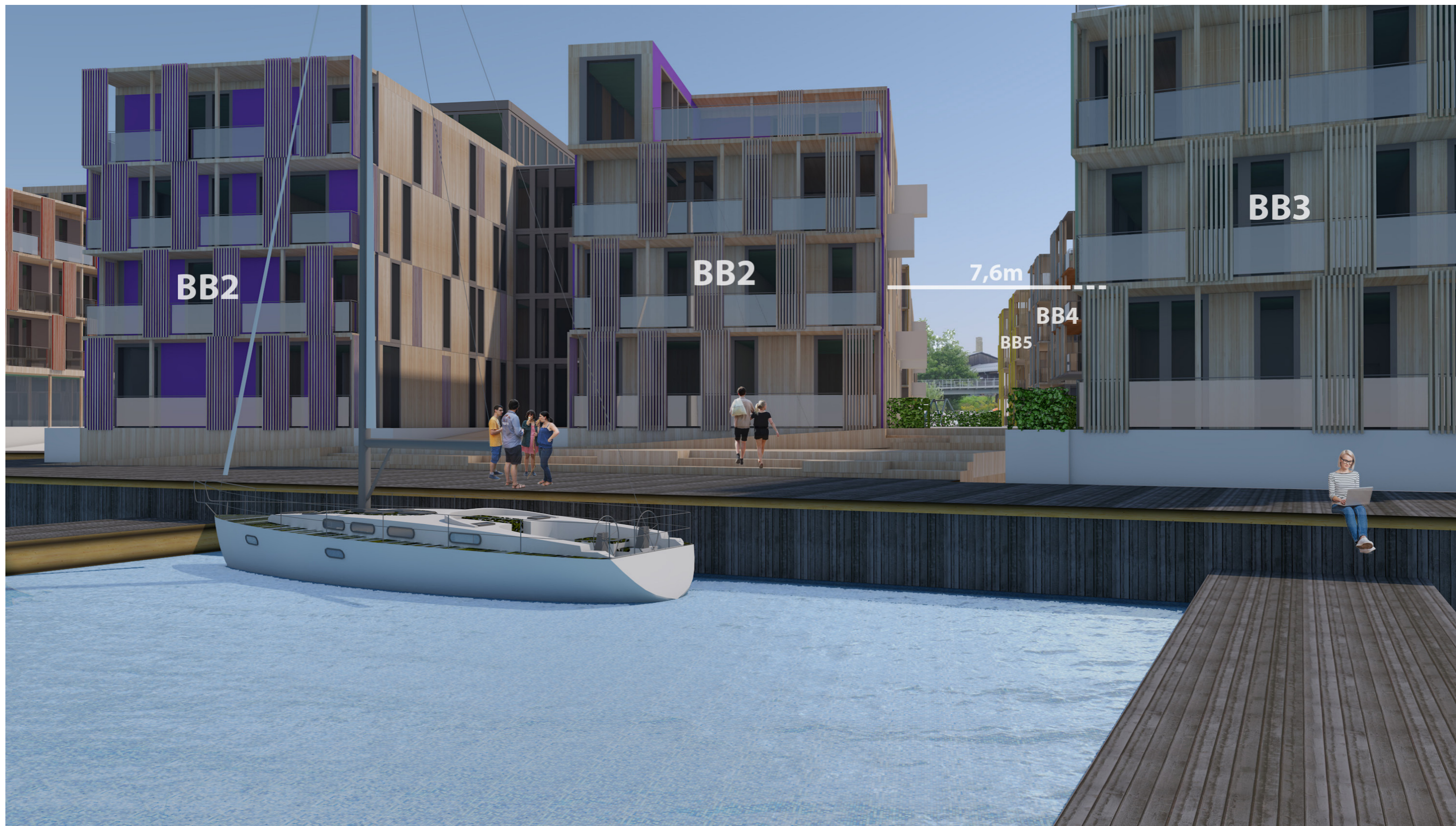
Fredrikshald brygge - Gaterom sett fra Brygge BG3 mot BB2 og BB3