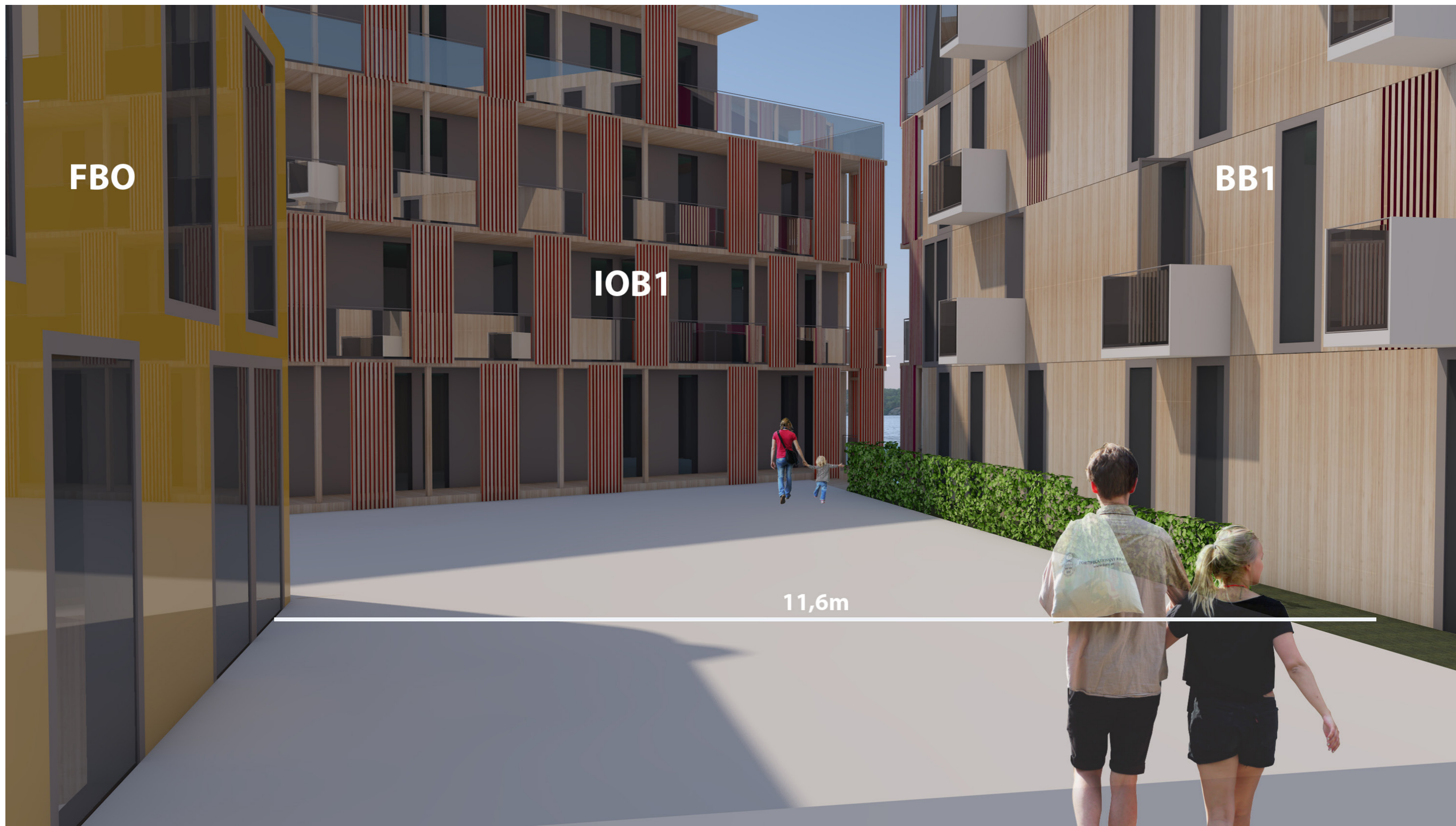
Fredrikshald brygge - Gaterom sett fra GT1 mot IOB1 og BB1