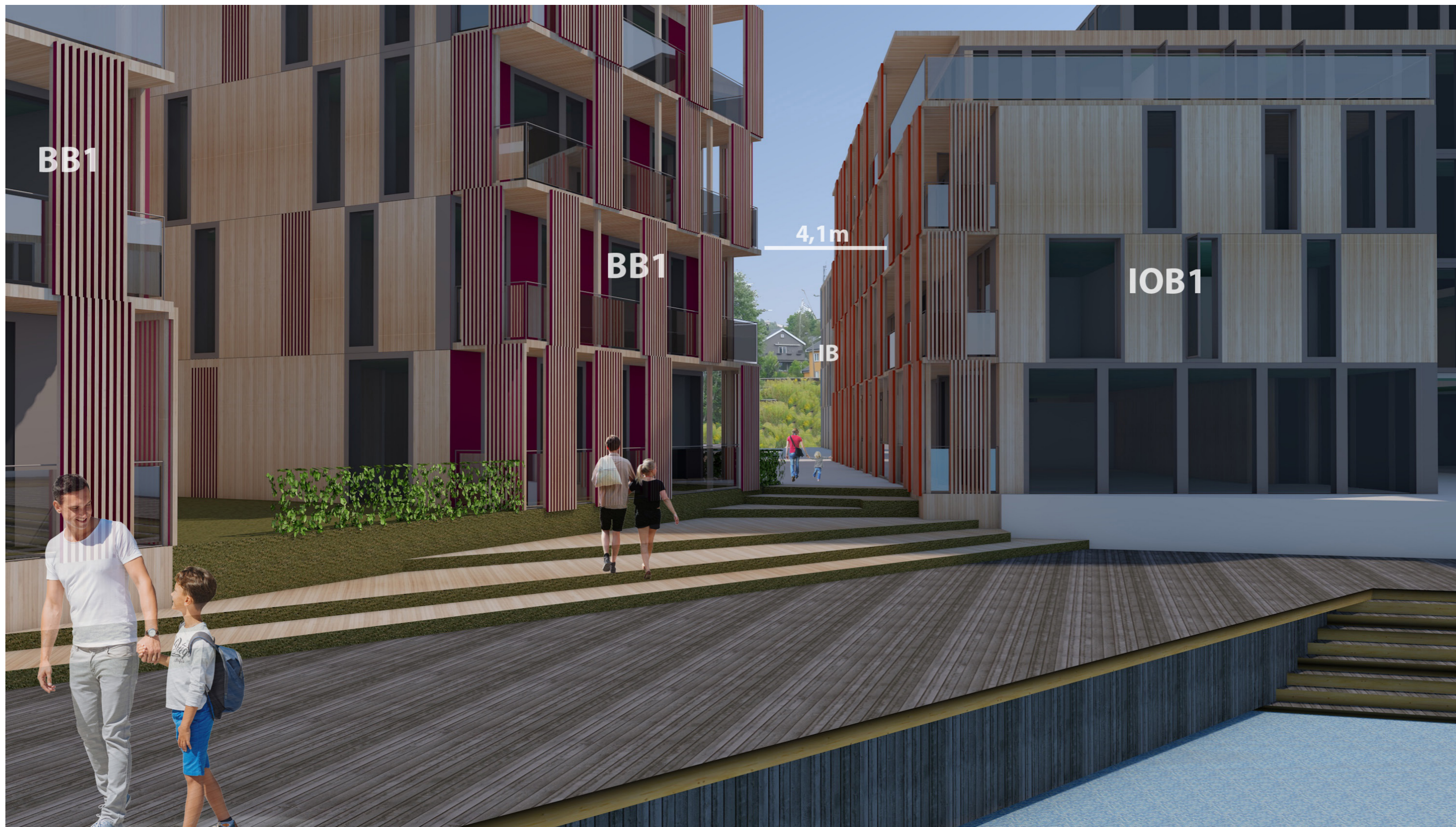
Fredrikshald brygge - Gaterom sett fra Brygge BG2 mot BB1 og IOB1