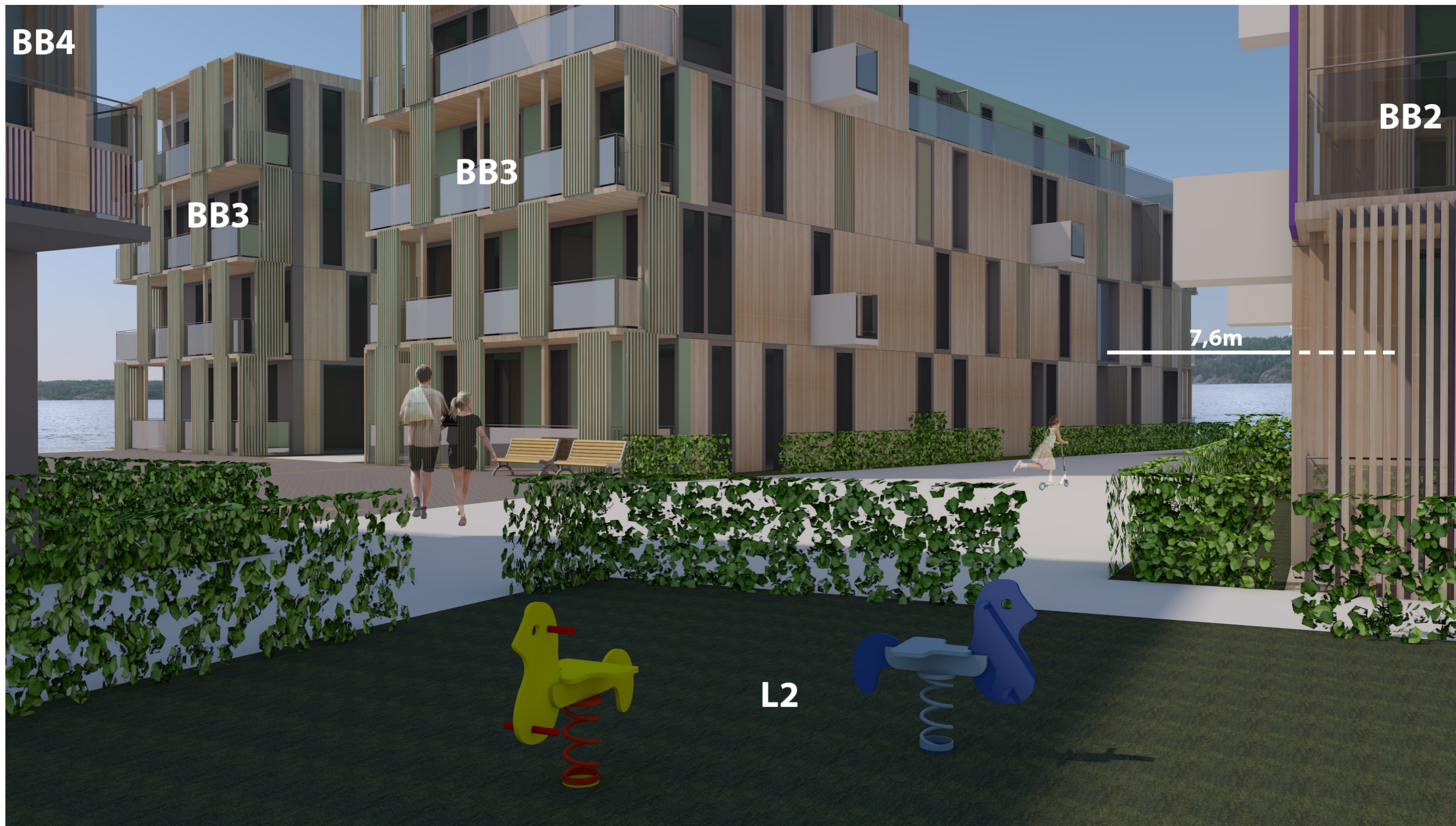
Fredrikshald brygge - Gaterom sett fra L2 mot BB3