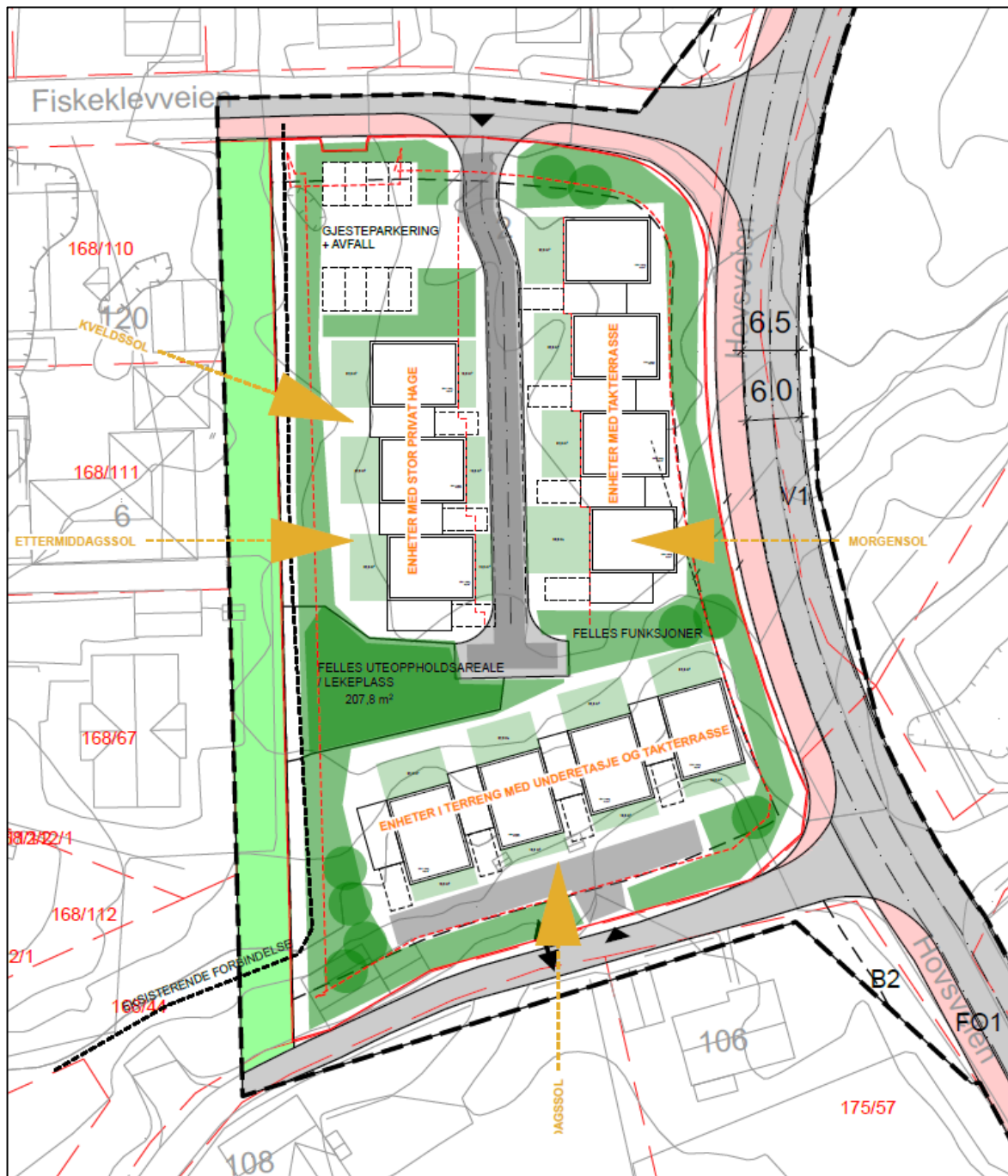
Figur 2. Innledende mulighetsstudie som viser en ønsket arealutnyttelse. Her er det lagt inn 11 boenheter som rekkehus.

Som en innledende del av planarbeidet er det utarbeidet en skisse som viser en mulig bygningsstruktur i det aktuelle området. Skissen viser 11 boenheter over to plan i rekke, med takterrasser over carport, og egne små hager i tillegg til fellesarealer. Denne skissen er ikke ment å legge føringer for planarbeidet, men eksemplifiserer en mulig utbygging.