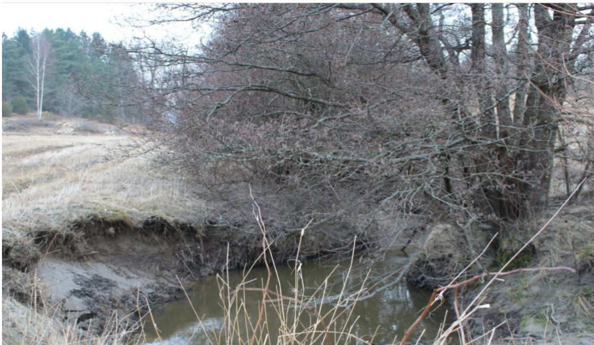
Tilskudd til sikring av bekkekanter faller innenfor SMIL-ordningen.