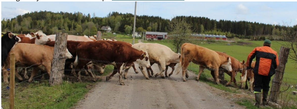
Enningedalen i april.

Tidligere nyhetsbrev finner du på kommunens nettside.