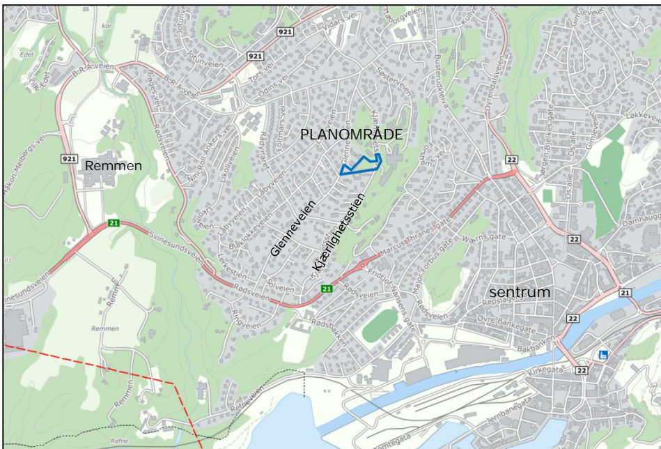
Figur 1: Planområdets beliggenhet, markert med blått omriss.

Planområdet utgjør ca. 6,5 daa og omfatter del av 61/217. Planområdets avgrensning framgår av kartet nedenfor.