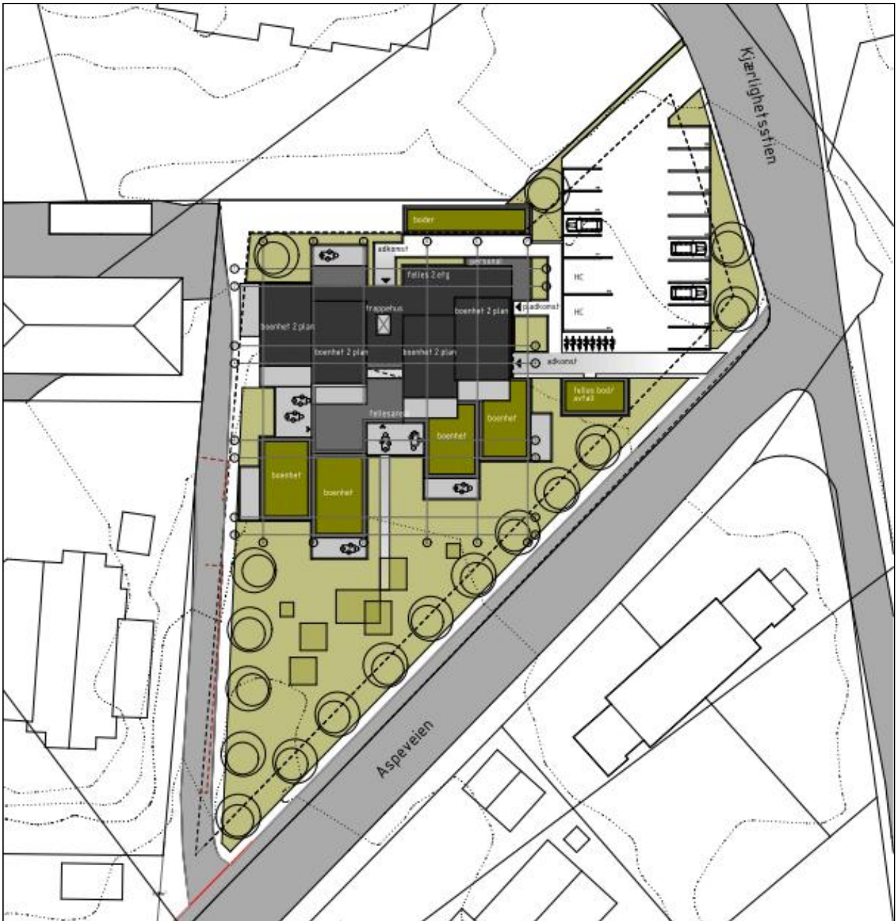
Figur 3: Situasjonsplan med tenkt løsning.